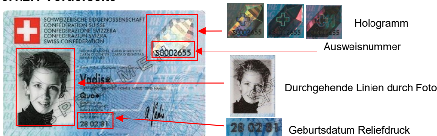
Abbildung 4: Vorderseite ID